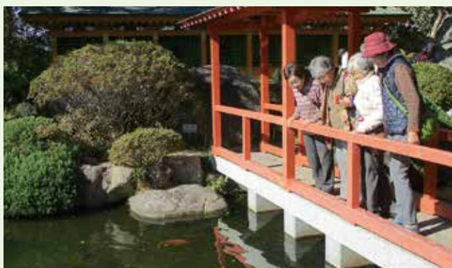
一人暮らし高齢者の日帰り旅行一部助成