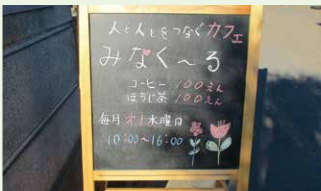
ボランティアサークル強化助成金