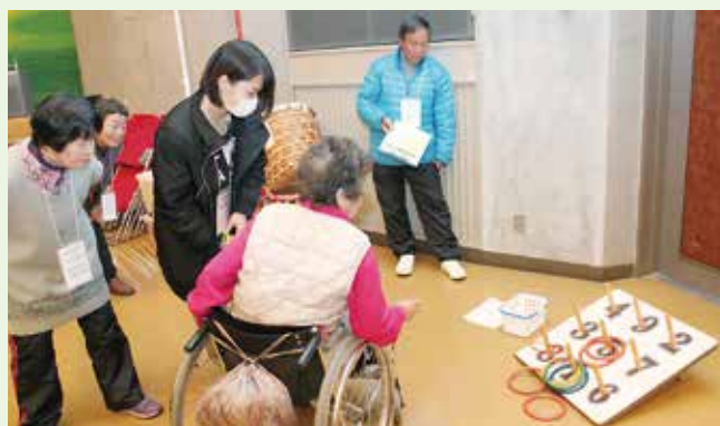
障害者ミニ運動会