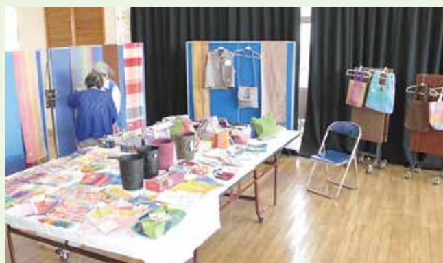
NPO法人あさひ等助成

※すべての事業につきまして、新型コロナウイルスの感染状況により内容の変更及び中止となる場合がございますので、予めご了承ください。