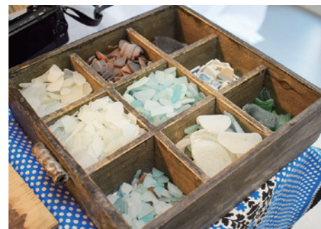
加工前のピーチグラス。これを加工して作られたアクセサリーがアップサイクルアクセサリーになります。

fullmoon は一日一組限定の特別なネイルサロン。場所が変わっても来てくれるお客様に対する思いは変わらず、丁寧な施術を心掛けています。