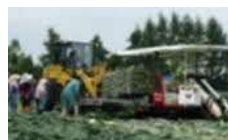
機械化体系の導入