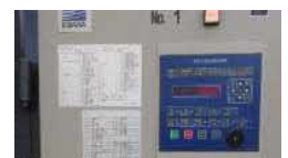
環境制御盤の導入