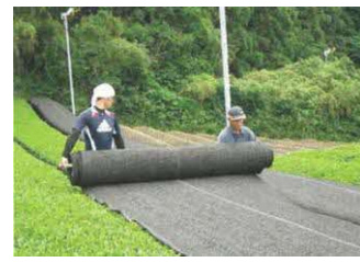
茶の被覆作業の実施