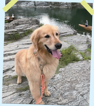
ぼく、おでかけ大好き♡ モコちゃん H24.3.28生