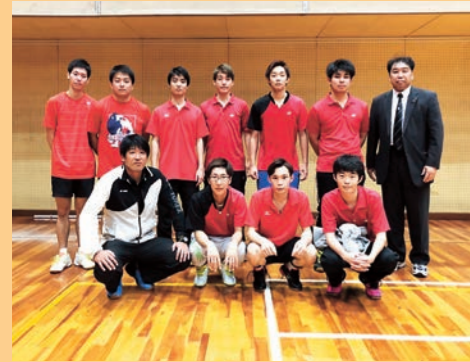
見事に3部昇格を決めた男子バドミントン部