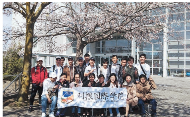
利根町で日本語を学ぶ「利根国際学院」の留学生の皆さん。日本語を勉強をしながら、利根町の魅力もたくさん知ってもらえたら嬉しいです。

この日は、午前と午後の2回、ルートを変えてゴミ拾いを行い、紙くずやペットボトル、折れた傘など、さまざまなゴミを回収、これらをさらに分別し処分したそうです。 今回のお花見&ゴミ拾いは、「留学生に利根町を知る機会を与えたい」という想いから、学院が企画したものです。習慣の異なる日本で勉強している留学生。私が留学生の立場だったら、慣れるまでは不安で、食事でも口に合わず痩せちゃうかもしれません...多分(笑) ご縁があって利根町で勉強することになった留学生の皆さん。町の皆さんと挨拶を交わし、交流する機会が増え、それが日本語の上達につながると思います。利根国際学院の皆さん、ゴミ拾い活動ありがとうございました!