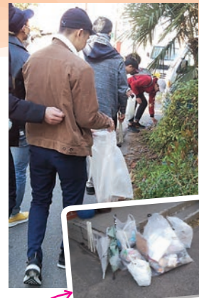
今回の清掃活動の成果!留学生の皆さん、お疲れさまでした!

女子バレーボール部が、4部リーグを1位で通過して見事に3部昇格を決めました。これで加盟から止まることなく一気に3部まで駆け上がってきました。また、バドミントン部(男子)も4部リーグを1位で通過、入れ替え戦に勝利して3部昇格を決めました。今後ともご声援、よろしくお願いたします。