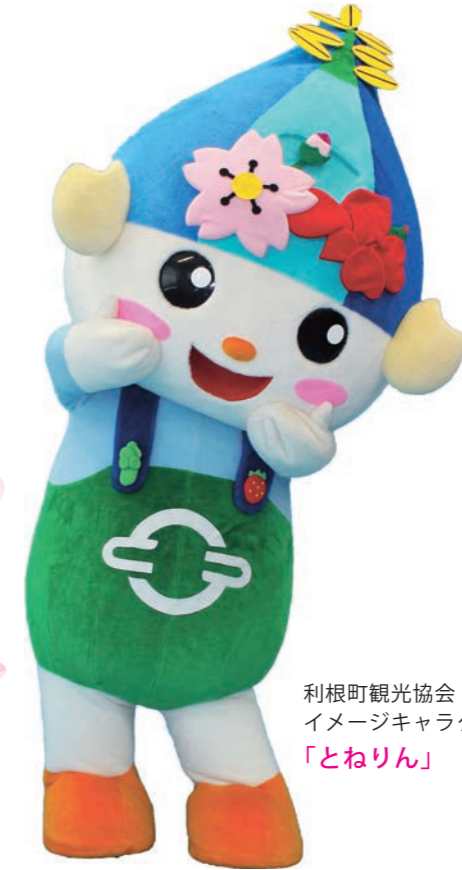
利根町観光協会 イメージキャラクター 「とねりん」

利根町を「とねりん」と一緒にPRしてみませんか？ 必要なのは元気とやる気だけ。 「とねりん」と一緒に