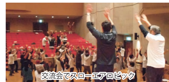
交流会でスローエアロビック

スローエアロビックとは? 最近の運動集会では、スローエアロビックを取り入れていますが、この運動はフリフリグッパ(体操の動きをもとに、それにノビユラ(体側を伸ばす)とフレアーツイス(体をひねる)を加えて、筑波大学の征矢教授グループにより考案されたものです。中高年層にマッチした適度な強さのフィットネスとして、特に脳への効果が期待されており、運動集会での体験を、ぜひお勧めいたします。