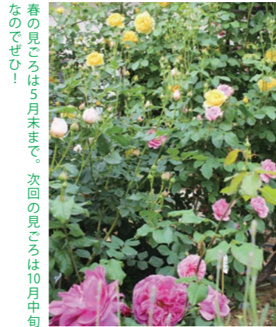
春の見ごろは5月末まで。次回の見ごろは10月中旬なのでぜひ!