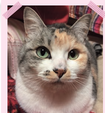
子供たちが大好き♡ まめちゃん H22.4.15生 9才