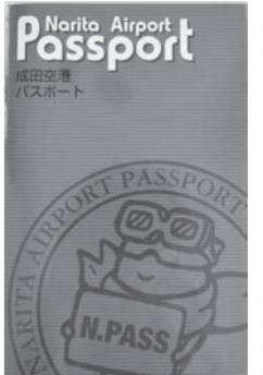
▲成田空港パスポート