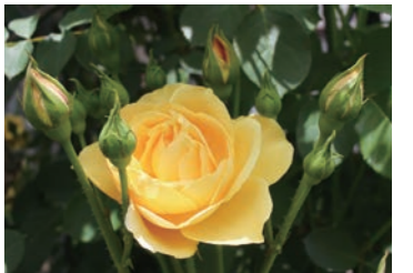
グラハム・トーマス

バラを通じてコミュニケーションを取ることが嬉しい バラを見て町民の方々にも楽しんでもらいたい