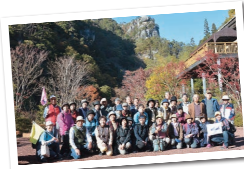
前回のハイキングは昇仙峡に行きました。会員以外の方も参加できます!

この日は、午前と午後の2回、ルートを変えてゴミ拾いを行い、紙くずやペットボトル、折れた傘など、さまざまなゴミを回収、これらをさらに分別し処分したそうです。 今回のお花見&ゴミ拾いは、「留学生に利根町を知る機会を与えたい」という想いから、学院が企画したものです。習慣の異なる日本で勉強している留学生。私が留学生の立場だったら、慣れるまでは不安で、食事でも口に合わず痩せちゃうかもしれません...多分(笑) ご縁があって利根町で勉強することになった留学生の皆さん。町の皆さんと挨拶を交わし、交流する機会が増え、それが日本語の上達につながると思います。利根国際学院の皆さん、ゴミ拾い活動ありがとうございました!