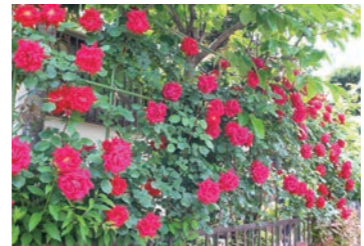
アンクル・ウォーター