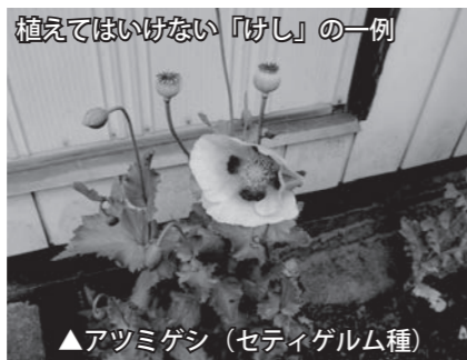
▲アツミゲン（セティゲルム種）