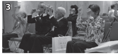
1.今年度で100歳！いつまでもお元気で。2～3.シルバーリハビリ体操を会場みんなで体験しました。4～8.会場を笑いと感動いっぱいにさせてくれた東筑波ユートピア猿芸の会および利根二葉幼稚園の園児たち。