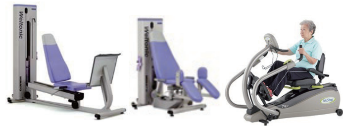
このような運動機器を使用します