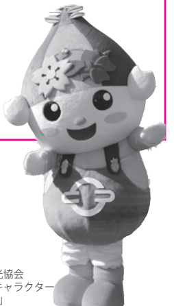
利根町観光協会イメージキャラクター「とねりん」