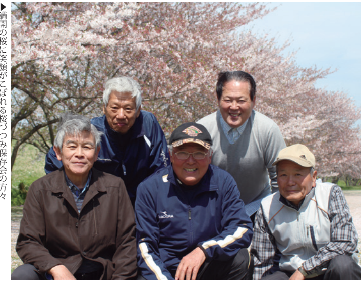
▶満開の桜に笑顔がこぼれる桜つつみ保存会の方々