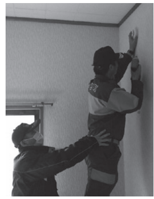
▲住宅用火災警報器を設置している消防署の方たち

この住宅用火災警報器は、一般社団法人全国消防機器協会が実施する「住宅用火災警報器等の配布モデル事業」により、町に寄贈されたものです。住宅用火災警報器は、火災発生をいち早く知らせ、被害拡大を防ぐものです。設置をしていない方は、寝室および寝室のある階の階段には設置をお願いします。