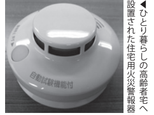
▲ひとり暮らしの高齢者宅へ設置された住宅用火災警報器