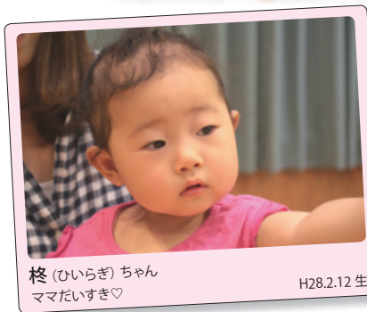
柊(ひいらぎ)ちゃん H28.2.12生 ママだいすき♡