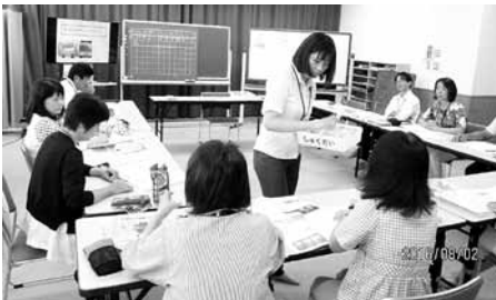
算数科の授業研修