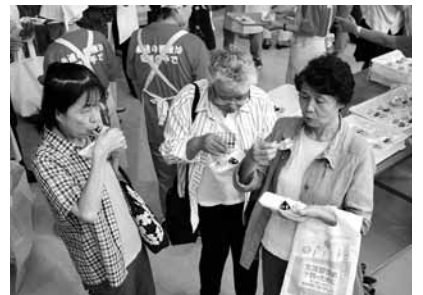
△講演終了後、災害食の料理を試食してもらいました