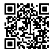
交付申請書 QRコード