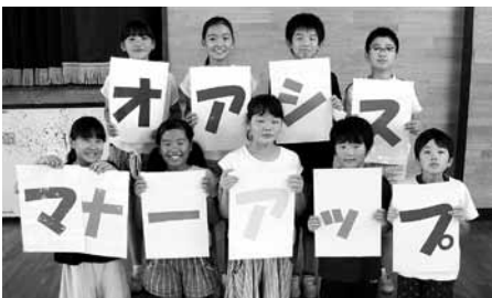
マナーアップ集会