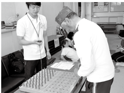
△手先の器用さを測定するペグ移動