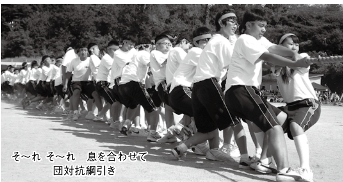
そ~れ そ~れ 息を合わせて 団対抗綱引き