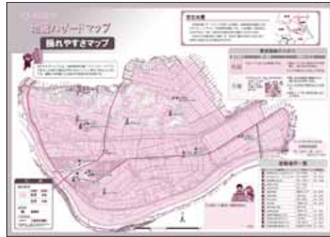
(左) 利根町洪水ハザードマップ (右) 利根町地震ハザードマップ