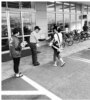
▷買い物に来た方に交通安全を呼びかけました。ヤオコー利根店

県内歴代第1位の記録を達成し、現在(10月1日)も更新中です。 日ごろから交通安全を心がけましょう。