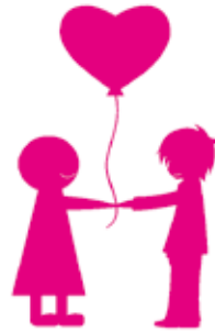
あなたの勇気一つで 命が助かる人がいます。