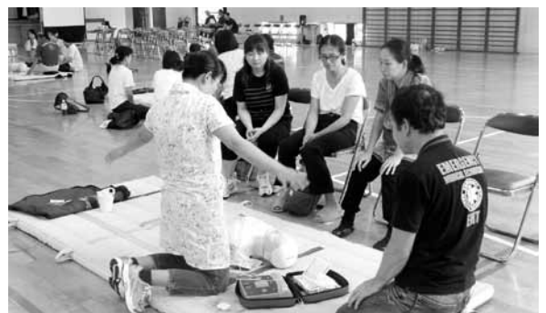
▷真剣に説明を受けるPTAの皆さん 布川小学校体育館

利根町では、町の公共施設(小中学校を含む)、町内セブナイイレブンにAEDを設置しています。