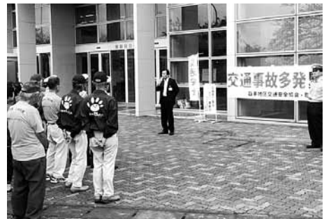
△キャンペーン前のセレモニー = 役場玄関前

秋の交通事故防止県民運動(9月21日(水)から9月30日(金)まで)の実施に伴い、9月21日(水)に利根町交通安全指導隊、利根町交通安全母の会、利根町ネットワークカー協議会、取手警察署、取手地区安全協会、利根町交番により、ヤオコー利根店、ランドルームフードマーケット利根店において交通安全啓発グッズを配り、交通安全を呼び掛けました。 町では、平成28年1月19日をもって、交通死亡事故ゼロ2310日を達成し、