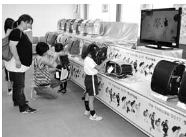
△子どもたちは、大喜びでランドセルを選んでいました

利根町では、子育て支援事業の一環として、来年度小学1年生になる子どもたちを対象に、お祝いとしてランドセルを贈呈しています。町では、9月14日(水)～10月2日(日)に役場4階会議室でランドセルの展示会を開催しました。会場には、色とりどりの男女合わせて31種類ものランドセルが展示され、訪れた家族は、実際に触れたり背負ったりして選んでいました。また、写真に撮って家族で相談したり、何度も足を運んでじっくり選んでいる家族も多く見られました。注文されたランドセルは、12月末ごろから配送され、ご家庭に届く予定になっています。