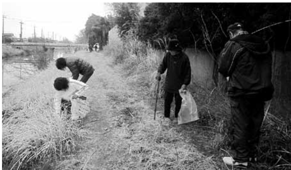
▷新利根川沿いを清掃する惣新田地区の皆さん