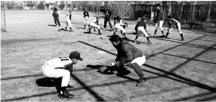
写真 ボールの握り方やボールの捕球などを真剣に学ぶ日本ウェルネススポーツ大学第2グラウンド

また、監督やコーチから保護者への講話があり「強い身体の作り方」や「けがの予防や付き合い方」など経験を交えて話をしていただきました。 参加された子どもたちや保護者からは「また教えてもらいたい」、「とても勉強になりました」など、たくさんさんの喜びの声が聞かれました。