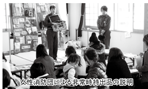
女性消防団による非常時持出品の説明

2月19日（金）、利根町民すこやか交流センターにおいて、乳幼児を抱えるお母さんを対象とした防災出前講座を開催しました。今回の講座では、過去の災害からの学び、ハザードマップ、自助・共助・公助について話をしました。また、女性消防団から乳幼児を抱えるお母さんのための非常持出品と備蓄品について説明があり、参加者は熱心に話を聞いていました。