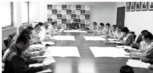
災害対策本部会議訓練

2月9日（火）、町職員による防災訓練を実施しました。この訓練は、大地震発生直後の初動対応を習得するためのもので、利根消防署、消防団幹部、茨城県南水道企業団、利根町社会福祉協議会の協力の下に行われました。