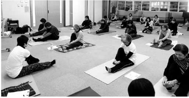
▷インストラクターから指導を受け、ヨガを楽しむ受講生

講座では、初心者向けの優しい動きのヨガを、自分の体と心の状態に合わせて、楽しみながら行いました。参加された方からは「たいへん楽しかった」、「続けて行いたい」との感想が寄せられました。