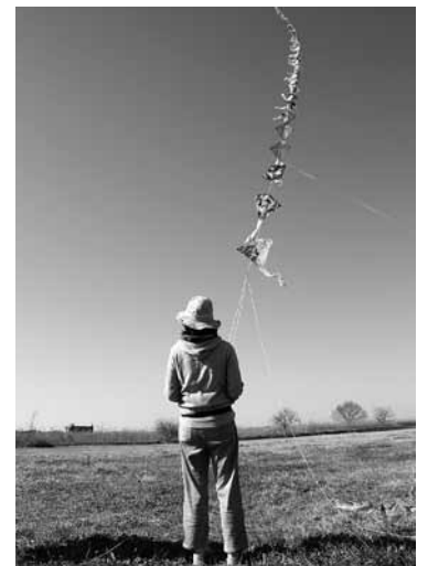
△青空に天高く揚がる連凧

今年で21回目を迎え、町内をはじめ千葉県、埼玉県からの愛好者の参加もありました。当日は雲ひとつない青空でしたが、風が弱い絶好の凧あげ日和とはいきませんでした。市販の凧や手作り凧をうまく風に任せ、大空に揚げていました。