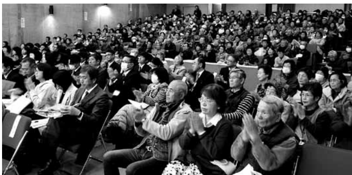
△熱心に話を聞く参加者。最後には大きな拍手が沸き起こりました