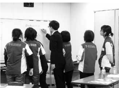
△講習会の様子＝利根町役場

役場福祉課 介護予防係 地域包括支援センター Tel 68-22211 (内線336)