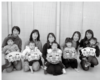
△羽根野「菜の花」の皆さん

♥羽根野「菜の花」 活動年数：読み聞かせの菜の花文庫から始まり20年以上の歴史あり 対象：羽根野と早尾地域、および近辺の文地域にお住まいの未就園の親子 活動場所：羽根野コミュニティセンター 活動日：第1、第3火曜日 時間：10時～正午