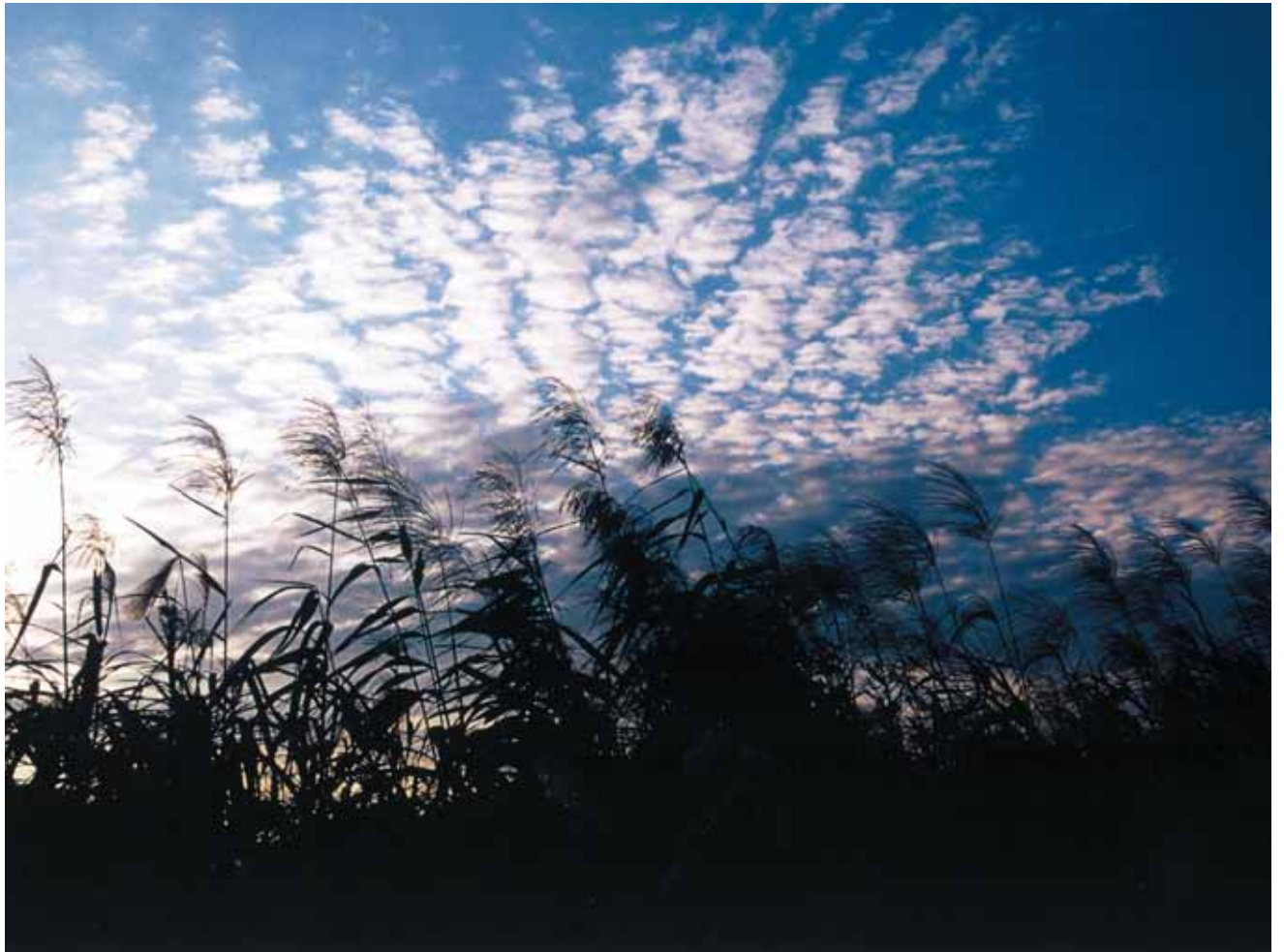
ススキと雲